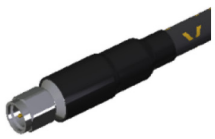
[DC ~ 18GHz]

Durch die Integration interner Materialtechnologien, die eine hervorragende elektrische Performance gegenüber Biegung und Temperaturschwankungen garantieren, zählen die Kabel von Sensorview zu den besten am Markt.