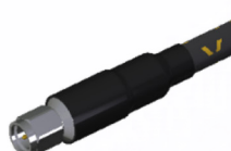
2.92mm(m) Straight [DC ~ 40GHz]