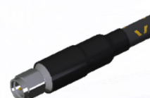
2.4mm(m) Straight [DC ~ 50GHz]