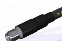
1.85mm(m) Straight [DC ~ 67GHz]