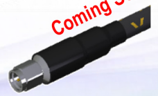
1mm(m) Straight [DC ~ 110GHz]