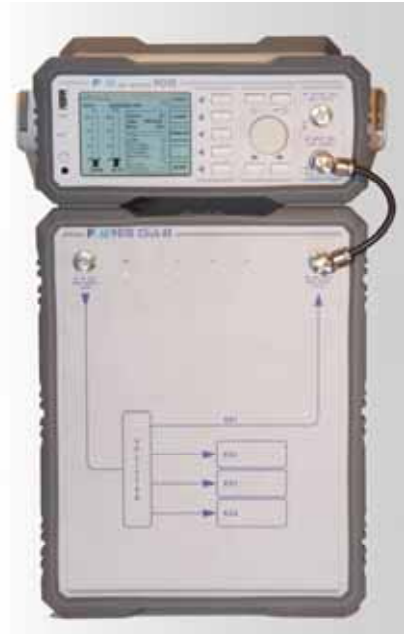
PMM 9010 mit Option 4-Kanal Click Meter.

LISN sind einphasig bis 16A und dreiphasig bis 350A erhältlich. Strom- und Spannungssonden sowie Rahmen und Stabantennen runden das Zubehör bis 30 MHz ab.